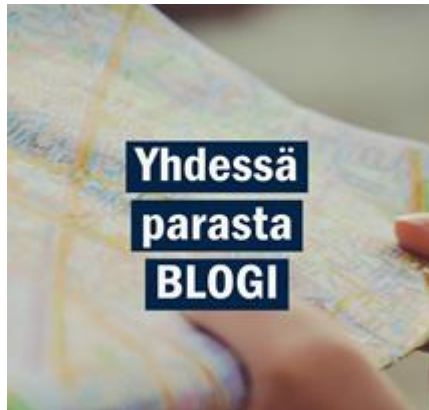
Yhdessä Parasta –blogi